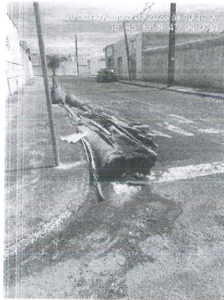
Figura 2: Desmonte e recolhimento do material.