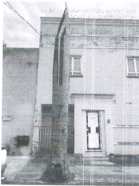
Figura 1: Estipe para desmonte.

Diante da situação, encaminhamos a autorização para desmonte para a Secretaria de Serviços Urbanos e Obras para conhecimento e execução, e solicitamos o recolhimento do material.